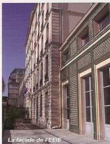
La façade de l'EEIE

Autre signe du développement de l'intelligence économique, le succès de l'EEIE (l'Ecole Européenne d'Intelligence Economique,